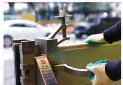
再導入把手將兩側迫緊即可完成組裝