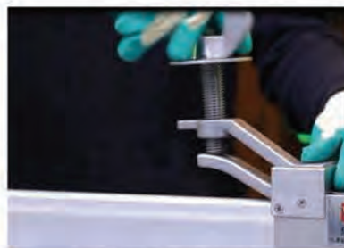
下壓特殊槓桿原理的壓迫鎖座