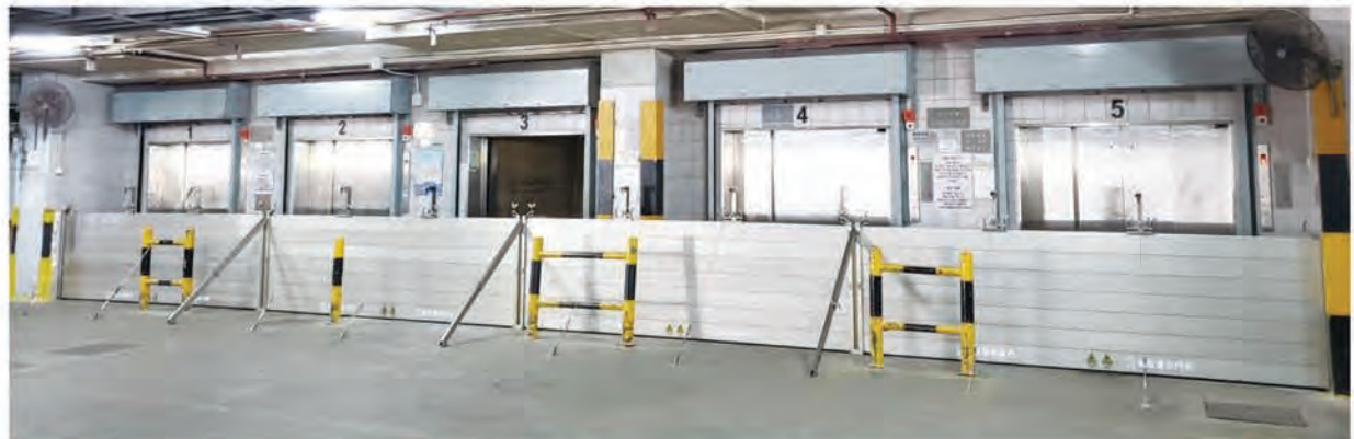
柴灣安全貨倉工業大廈